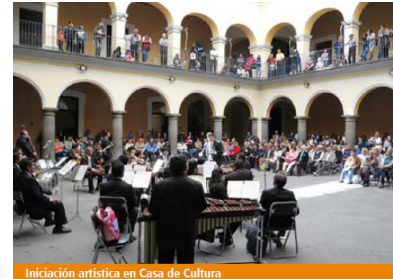
Iniciación artística en Casa de Cultura

En la música se fortaleció la formación de nuevos públicos en las siete regiones de la entidad. Las agrupaciones estatales encabezadas por la Filarmónica 5 de Mayo durante 2017 han tenido presencia en 33 municipios y localidades del estado, con un total de 130 mil 907 asistentes a 161 eventos. A lo anterior, se suman las manifestaciones tradicionales, a través de los programas de la Orquesta Típica del Estado de Puebla y la Banda Sinfónica del Centro de Capacitación de Música de Banda.