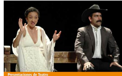
Presentaciones de Teatro

Durante la celebración del Día Mundial del Teatro, se presentaron dos obras de nivel internacional: Lo que el amor puede, el amor lo intenta y Wenses y Lala. Además, se llevó a cabo un taller para intérpretes de cabaret. Estas actividades permitieron beneficiar a un total de 800 personas.